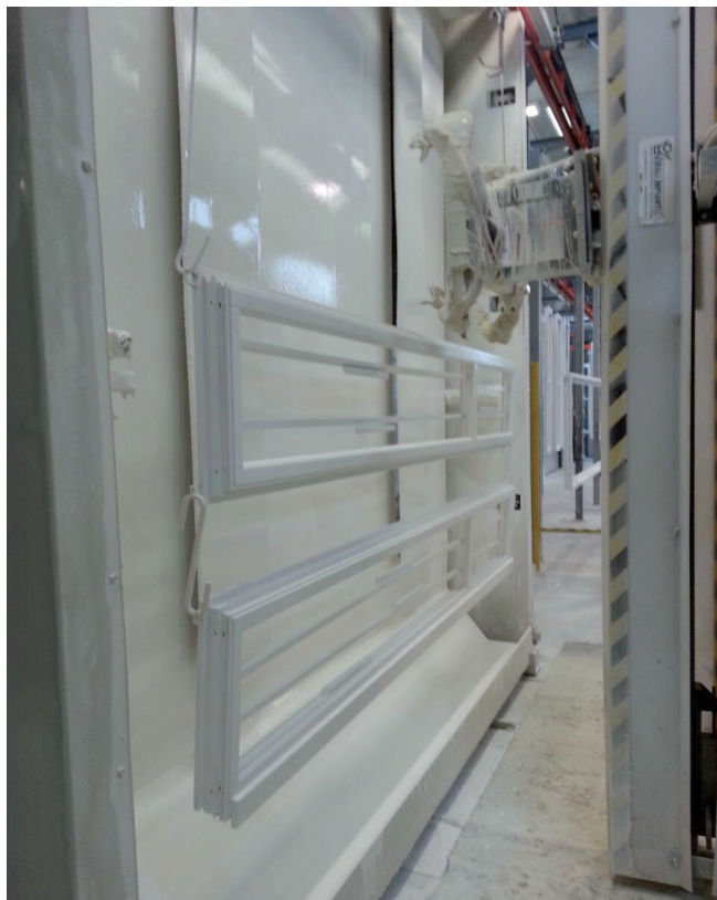
3 - Un dettaglio dell'applicazione automatica della finitura.

A detail of the automatic finishing plant