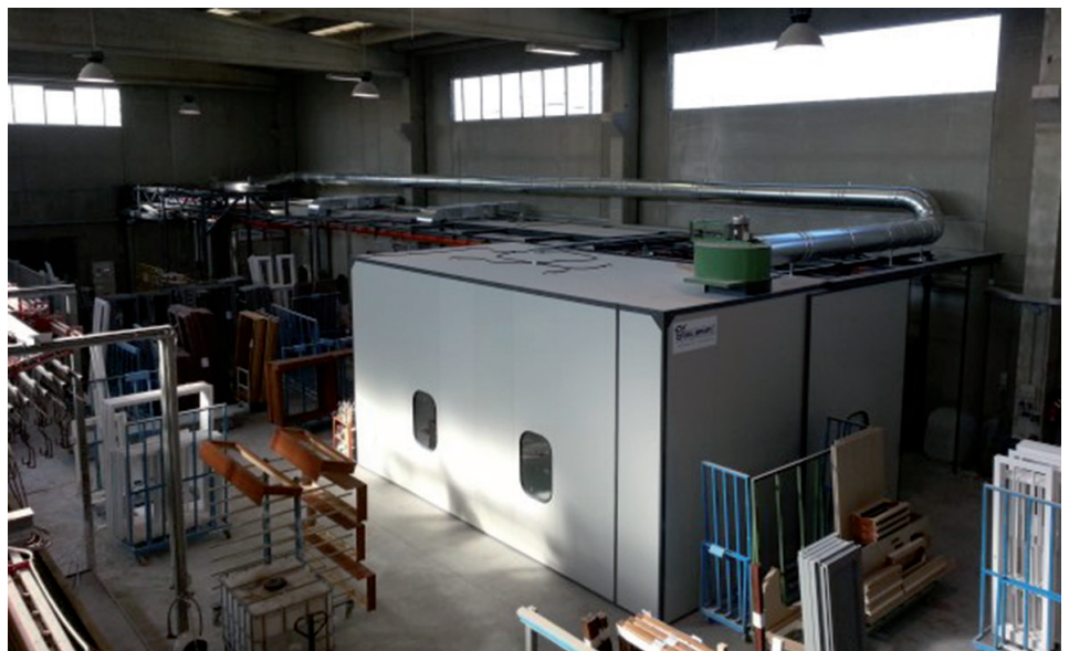
3 - La cabina per la carteggiatura The sanding booth.